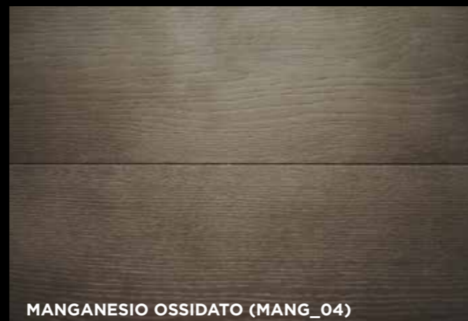
MANGANESIO OSSIDATO (MANG_04)

Fer oxydé / Oxidized Iron / Hierro oxidado