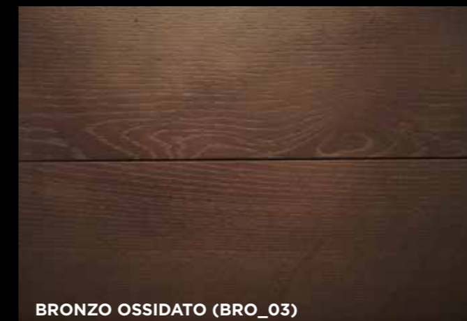
BRONZO OSSIDATO (BRO_03)

Or Rose oxydé / Oxidized Rose Gold / Oro Rosa oxidado