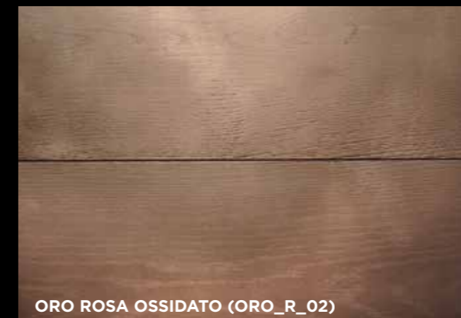
ORO ROSA OSSIDATO (ORO_R_02)

Or Rose oxydé / Oxidized Rose Gold / Oro Rosa oxidado