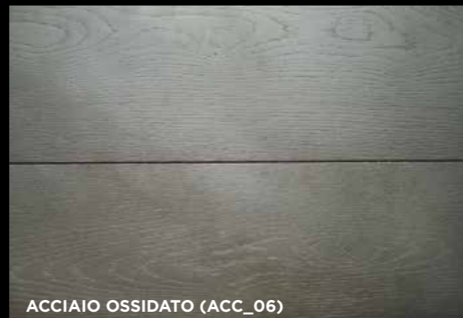
ACCIAIO OSSIDATO (ACC_06)

El número después de la barra “/” se refiere al espesor nominal, en mm, de la madera noble